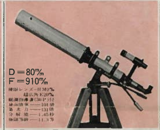
オズマ80 46~101倍 超大型5段調節三脚・カートンボックス付 定価 27,800円 (荷造送料1,500円)