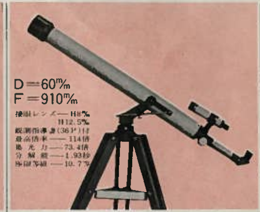
イカルス 73~114倍 大型5段調節木製三脚・三角ボックス付 定価 12,900円 (荷造送料1,200円)