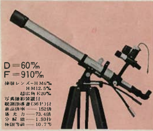
E-M-Cas 46~152倍 超大型5段調節木製三脚・ダブルカートン格納箱付 定価 22,500円 (荷造送料1,200円)