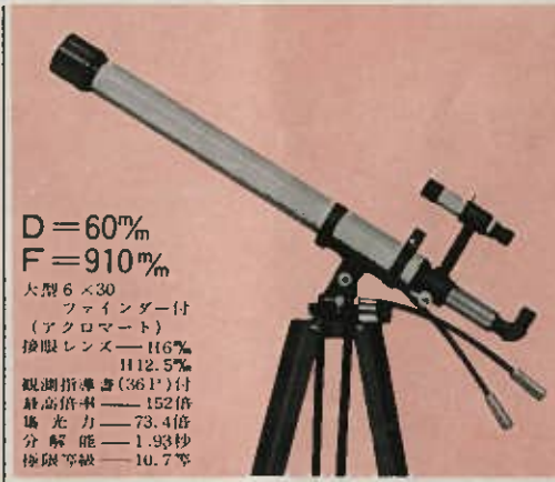
プラネート 73~152倍 大型5段調節木製三脚・ダブルカートン格納箱付 定価 18,500円 (荷造送料1,200円)