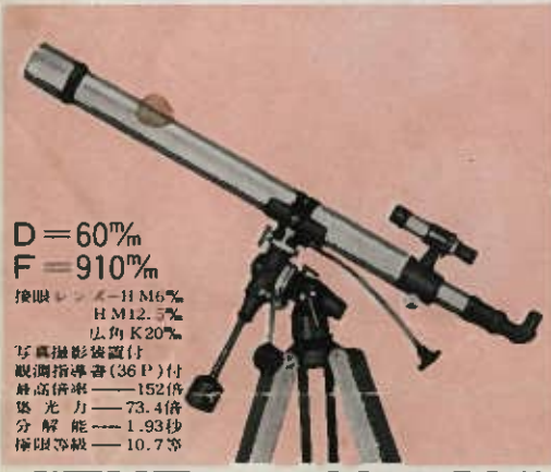
ポタリス (マーク1) 46~152倍 超大型5段調節木製三脚・カートンボックス付 定価 35,000円 (荷造送料1,500円)

(送り先) 東京都新宿区原町3の13 千162 株式会社ビクセン 作品大募集係まで