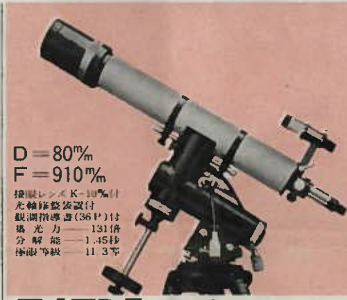
タيرانI号 91倍 鉄ハイフ三脚付 定価 65,000円 (荷造送料3,000円)